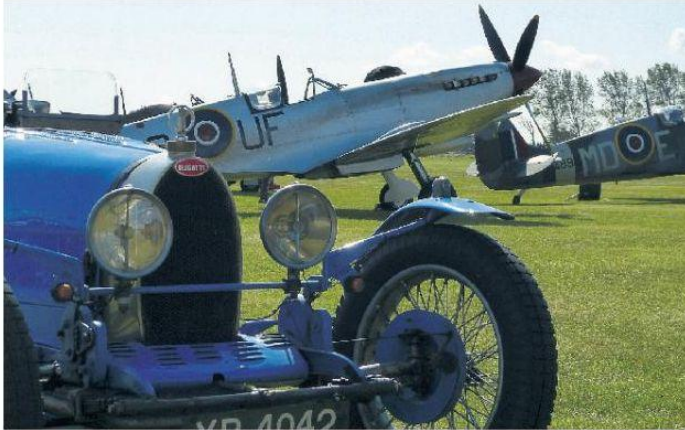
Tolle Idee: ein fahrendes und ein fliegendes Museum im Rahmen eines Picknicks und mit Duellen auf der Rennpiste zu präsentieren.

Mit „Wheels meet Wings“ erweitert der MSC Emstal sein Engagement um einen für ihn ganz neuen Bereich. Eine Oldtimerveranstaltung mit Automobilen, Motorrädern und Flugzeugen durchzuführen, ist für die Veranstaltergemeinschaft eine große Herausforderung. Eine Begegnung dieser Art hat es in Hessen noch